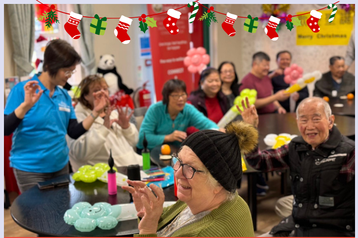
松鶴樓居民們一同製作節慶裝飾和手工藝品