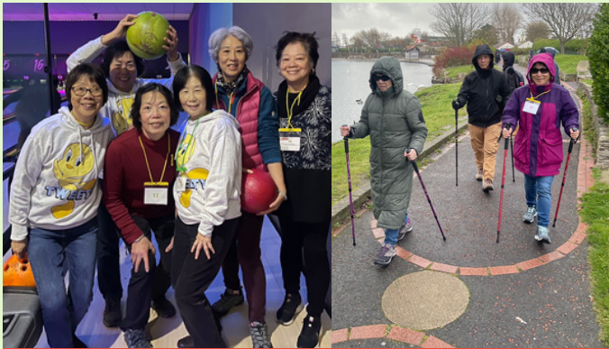
Nordic Walking and Bowling day trip at Southport...

社區同樂踴躍參與了我們舉辦的Southport歐式健走和保齡健康一日遊。活動不僅促進人際關係，共享歡樂，更為重要的是提升了參與者的身心健康和社交福祉。活動充分展現社區參與的力量，同時也明確證實了體力活動對身心愉悅的積極影響。衷心感謝Big Help Project的慷慨贊助，讓我們得以匯集社區，並推廣各種形式健康福祉的重要性。我們收到了許多積極的反饋，感謝大家讓我們度過了如此美好的一天。